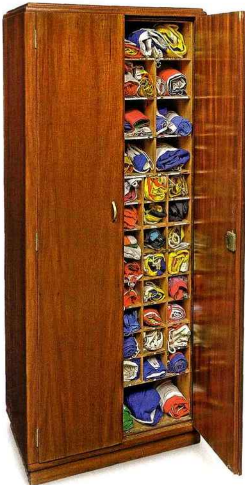
Grande armoire à fanions , provenant de la passerelle du paquebot Mermoz, acajou, laiton, 80 x 45 x 198 cm, est. : 1 100 - 7 300 euros.